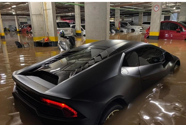
Manutenção hidráulica, ralos limpos e sistema de escoamento de água pluvial são fundamentais para evitar alagamento da garagem

As inundações são um problema recorrente em várias cidades brasileiras, especialmente na época de chuva. Por isso, é importante saber como evitar e o que fazer em caso de alagamento da garagem do condomínio